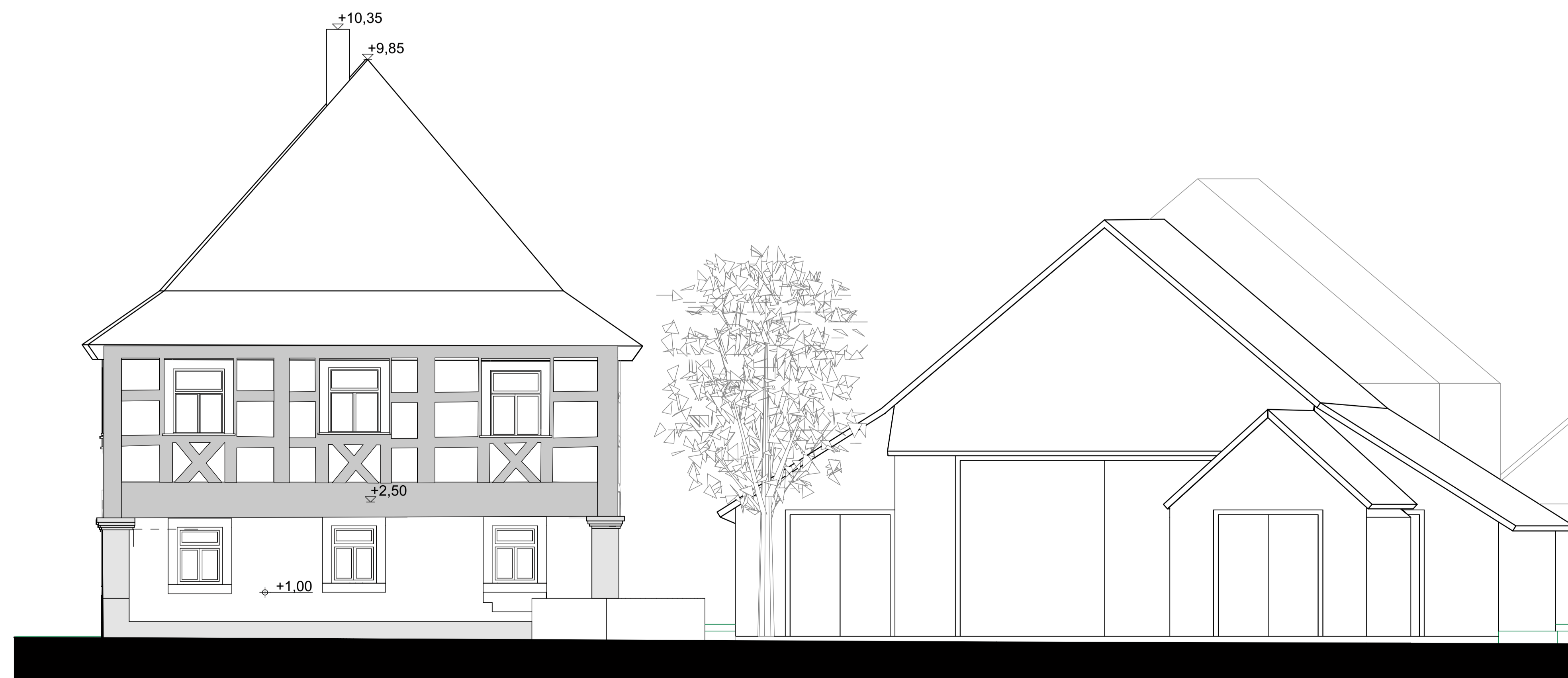
Ansicht von Osten