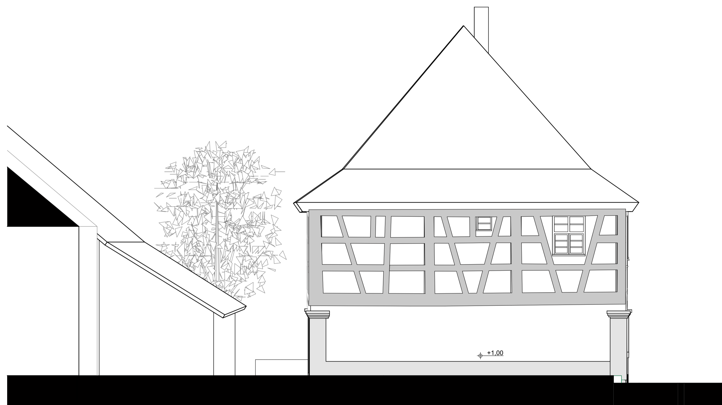
Ansicht von Westen