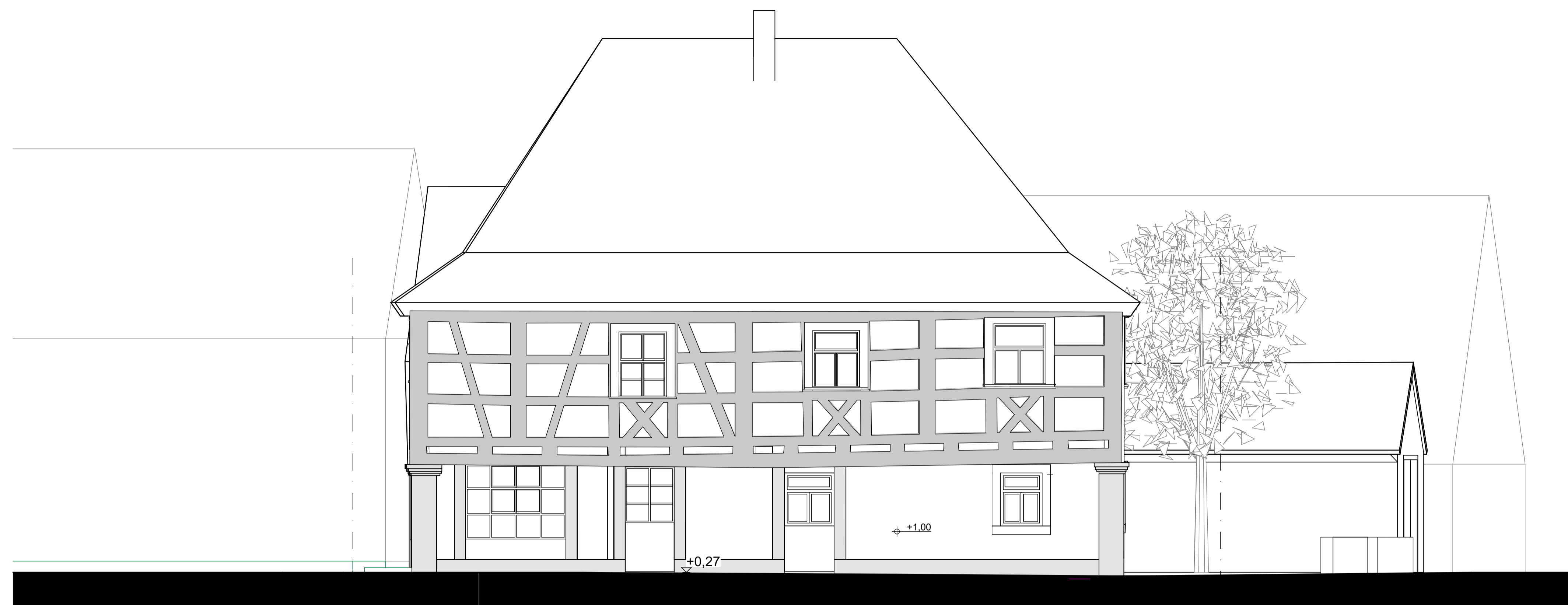
Ansicht von Süden